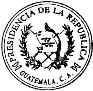
OTTO FERNANDO PÉREZ MOLINA Presidente de la República

Sin otro particular, aprovecho la oportunidad para reiterarle las muestras de mi consideración y estima.