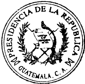
OTTO FERNANDO PÉREZ MOLINA Presidente de la República

Sin otro particular, aprovecho la oportunidad para reiterarle las muestras de mi consideración y estima.