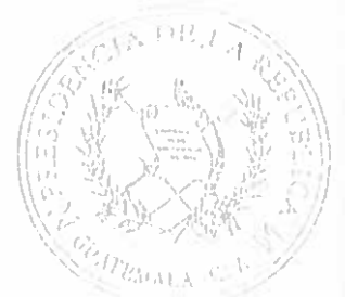
OTTO FERNANDO PEREZ MOLINA